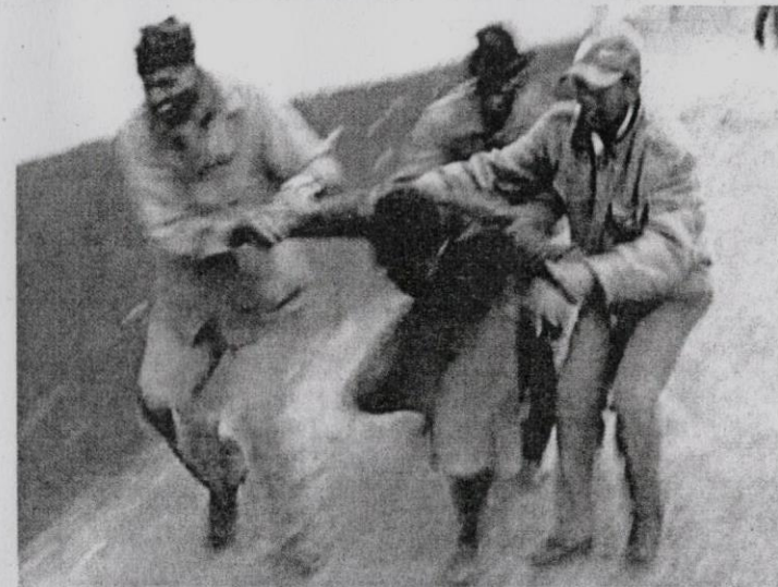
Tradisi culik dan lari atau ukuthwala juga berleluasa di beberapa kawasan di Afrika Selatan.

Culik pengantin perempuan adalah tradisi kuno yang berasal dari Rom sebelum merebak ke bahagian lain di dunia secara berperingkat. Beberapa bahagian Rusia dan negara sekitarnya masih mengamalkannya, namun masih berpegang teguh kepada tradisi dan mematuhi undang-undang. Kini, ia dilarang oleh undang-undang Moscow tetapi masih diamalkan dengan cara yang telah diubah suai.